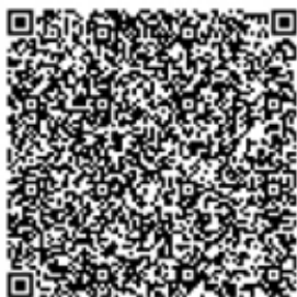
QR код № 1